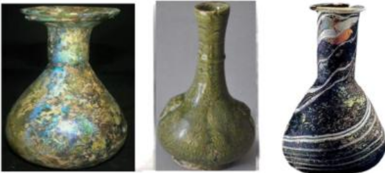
埃及出土的罗马搅胎玻璃瓶(公元 1 世纪) 大月氏王陵出土的罗马搅胎玻璃瓶(公元 30 年) 洛阳东汉墓出土的罗马搅胎玻璃瓶(公元 2 世纪)

2. 下图是分别在埃及、阿富汗和中国出土的罗马搅胎玻璃瓶，有学者指出它们是罗马工匠制作的。这可用于佐证