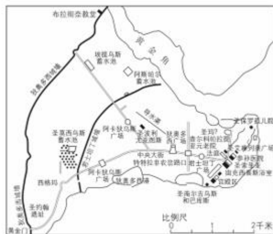
5—6 世纪君士坦丁堡平面图